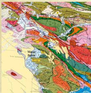
Extrait de la carte géologique de la France au 1/1000000

Parmi les importantes secousses voisines de la côte Atlantique, rappelons celles du 9 janvier 1930 (VII, Vannes), 2 janvier 1959 (VII, Quimper), 7 septembre 1922 (VII, Oléron).